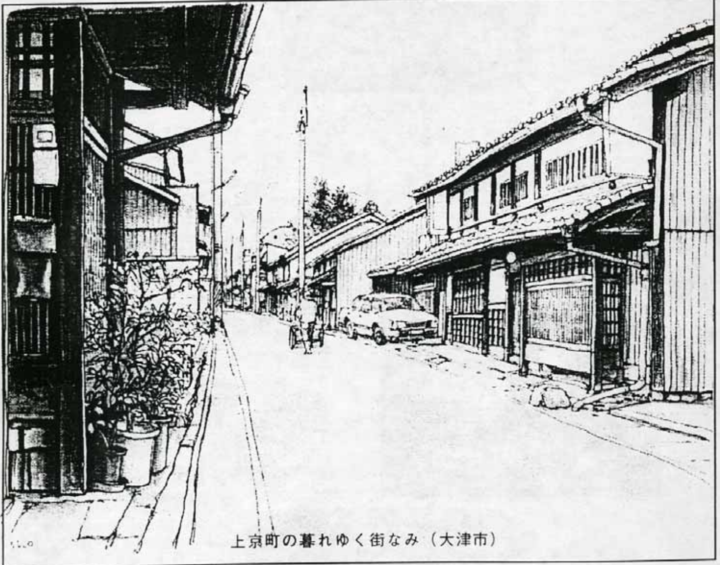
上京町の暮れゆく街なみ（大津市）