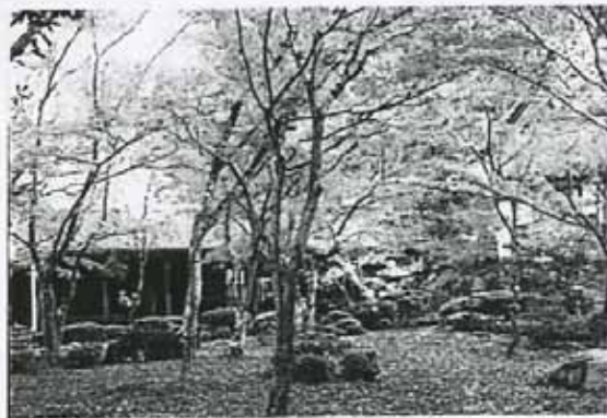
犬上郡甲良町の西明寺は、平安時代の初期、三修上人が仁明天皇の勅願により