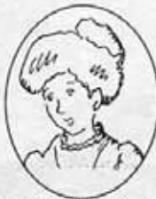
■執筆者プロフィール